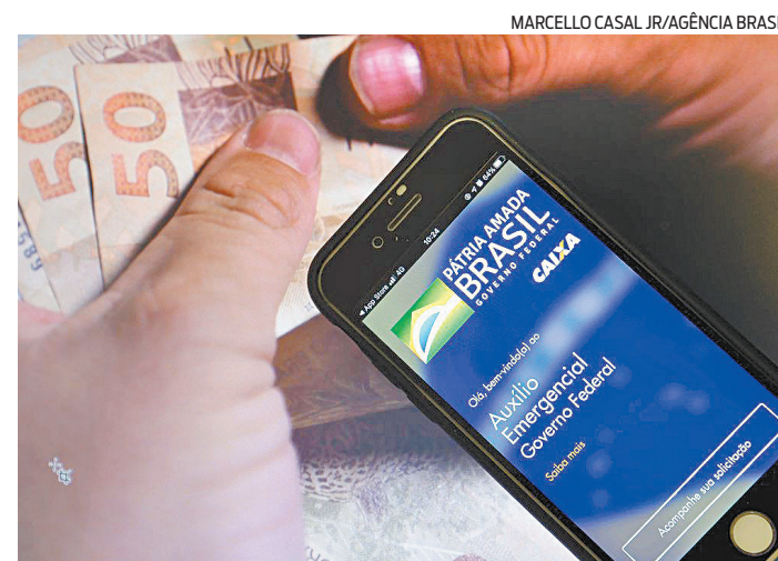
A partir de hoje, valores podem ser movimentados pelo Caixa Tem

(capitais), 0800-729-0001 (demais localidades) e 0800-729-0088 (telefone especial exclusivo para deficientes auditivos) e agendar o crédito em conta ou poupança, em seu nome, em qualquer banco. É possível fazer o agendamento no Portal BB, acessando o endereço: htps://www.bb.com.br/irpf .