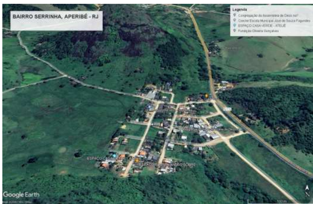
IMAGENS GOOGLE EARTH