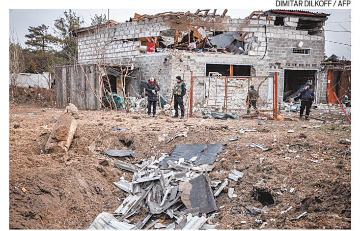
Moradores de Kiev observam cratera em frente a uma casa

Na sexta-feira, 18, o fundador do Telegram, o russo Pavel Durov, admitiu que a empresa foi negligente e atribuiu o descumprimento das ordens judiciais a uma confusão de emails. Na mensagem que circulou pelo aplicativo, Pavel ainda pediu desculpas a Alexandre de Moraes e afirmou que irá cumprir com as decisões da Justiça.