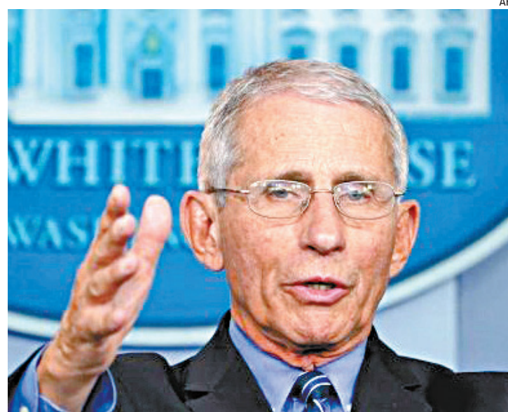
Anthony Fauci diz que “sinais são um tanto encorajadores”

Testes de laboratório tentam determinar se a ômi-